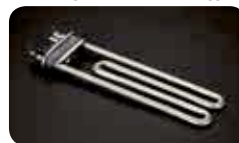
Saubere Elemente / Résistance propre / Resistenza pulita