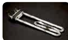
Defekte Elemente / Résistance endommagée / Resistenza danneggiata

Entfernt unangenehme Gerüche Supprime les mauvaises odeurs Rimuove i cattivi odori