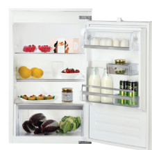
KRIE 1883 A++