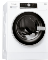
WA PRIME 954