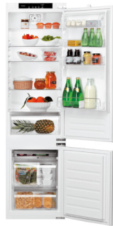
KGIS 3194 A++ SF