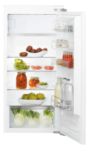
KVIE 1123 A++