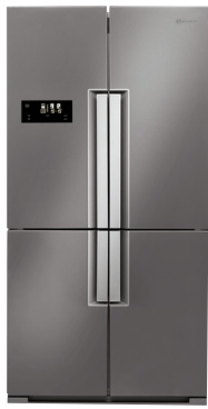
KSN 4T A+ IN