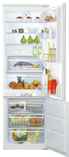
KGN 3185 A++