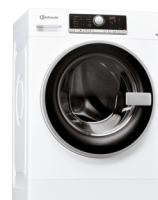
WM PRIME 824