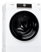
WA PRIME 1054