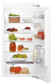
KRIE 1122 A++