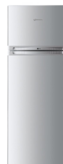
KDA 2460 A+ IO