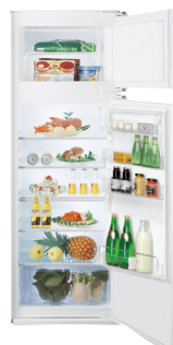
BDP 28 A++