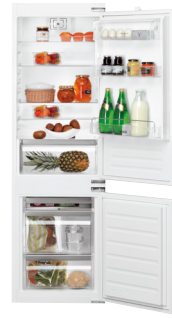
KGIE 1180 SF A++