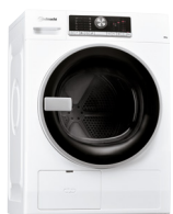
TK PLATINUM 871 E