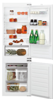
KGIE 1182 A+